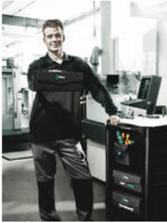
Wera 2go 3 - Der Drinpacker