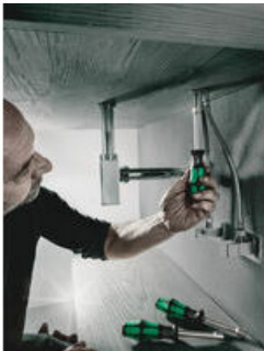
Hohlschaft für überstehende Gewindestangen