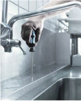
Edelstahl mit Edelstahl verschrauben!