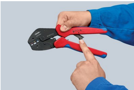
Servicehebel einklappen und Zange durchdrücken – bereit für den nächsten Einsatz