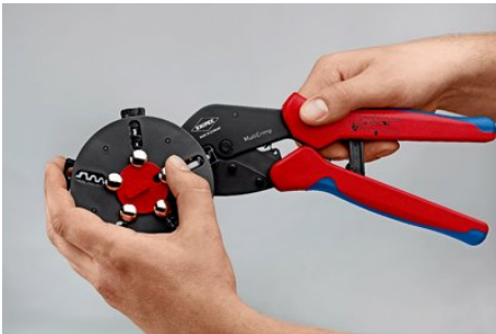
Crimpeinsatz-Wechsel: Magazinposition entsperren, Crimpeinsatz in der Zange entnehmen

Technische Änderungen und Irrtümer vorbehalten