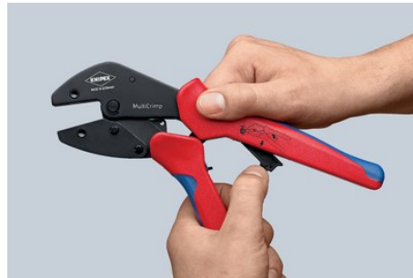
Wechselposition: Ausklappen des Servicehebels für parallele Backenstellung