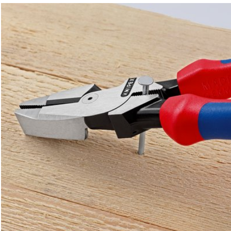
Greifzone unterhalb des Gelenks für kraftvolles Hebeln

Technische Änderungen und Irrtümer vorbehalten