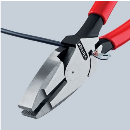
09 11/12 240: Universelle Dorn-Crimpstelle unterhalb des Gelenks