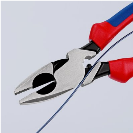
09 11/12 240: Kabel-Einziehhilfe im Gelenkspalt