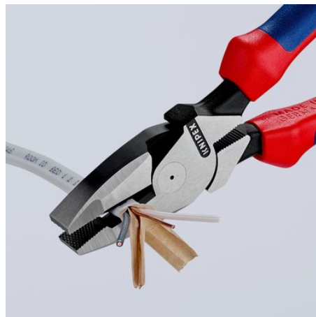
Lange Schneiden zum Trennen von flachen Kabeln