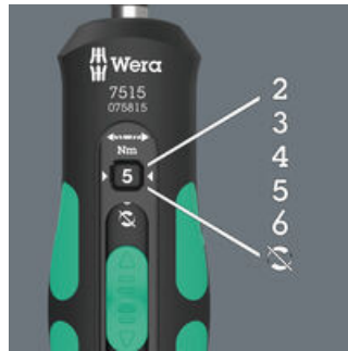
Fünf wählbare Anzugsdrehmomente (2,0; 3,0; 4,0; 5,0; 6,0 Nm) und eine Fest-Stellung (Torque Lock) für unbegrenzte Löse- und Anzugsmomente.