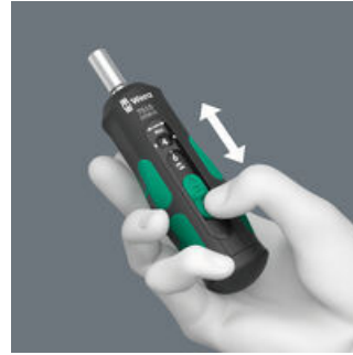
Einfache Einstellung der wählbaren Anzugsdrehmomente.