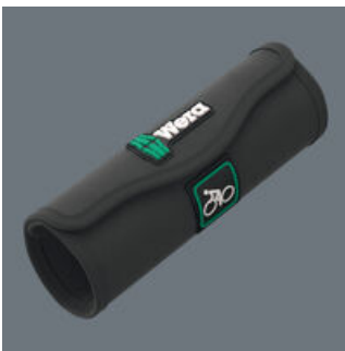
Aufbewahrung und Transport in einer robusten und kompakten textilen Rolltasche. So ist das Werkzeug immer zur Hand.