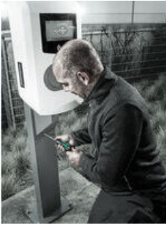
Drehmomentschraubendreher mit Schnelleinstellung