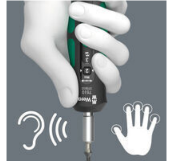
Deutlich hör- und spürbares Überrassten beim Erreichen des eingestellten Drehmomentes.