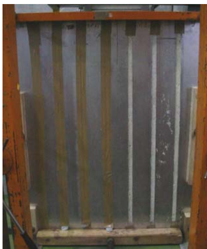
Abbildung 1 Geschäumte Fugen in Prüfvorrichtung für Längsfugen nach DIN 18542, aufgebaut auf dem Fensterprüfstand

Fotos wurden im ift während der Prüfung erstellt.